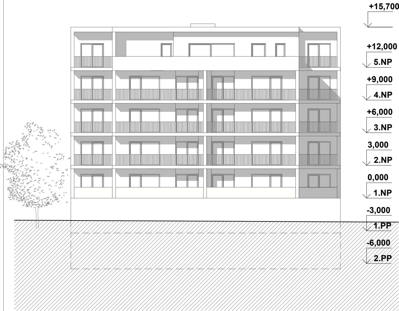
POHLED ZADNÍ (OD ULICE PETRA KŘIVKY) -JIHOVÝHODNÍ